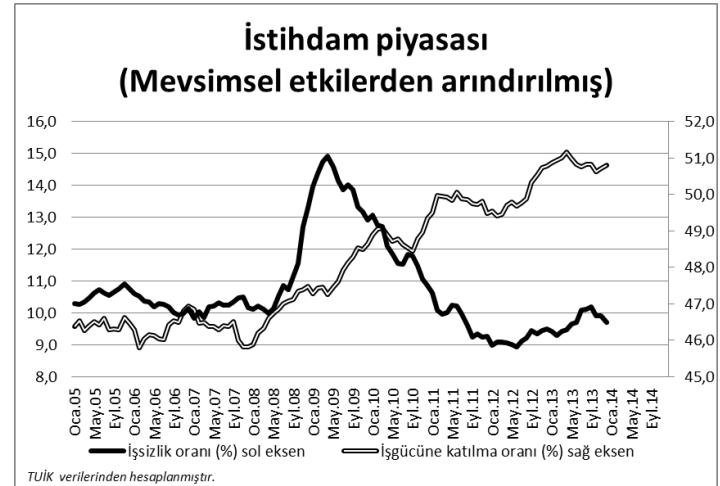
Şekil 2: İstihdam piyasası (2005 – 2013)

Bölgesel verilere bakıldığında, en yüksek işsizlik oranının %21,1 ile TRC3 (Mardin, Batman, Siirt, Şırnak) bölgesinde olduğu görülürken, işgücüne katılım oranının en yüksek olduğu bölge ise %58,3 oranı ile TRA2 (Kars, Ardahan, Iğdır, Ağrı) bölgesi oldu.