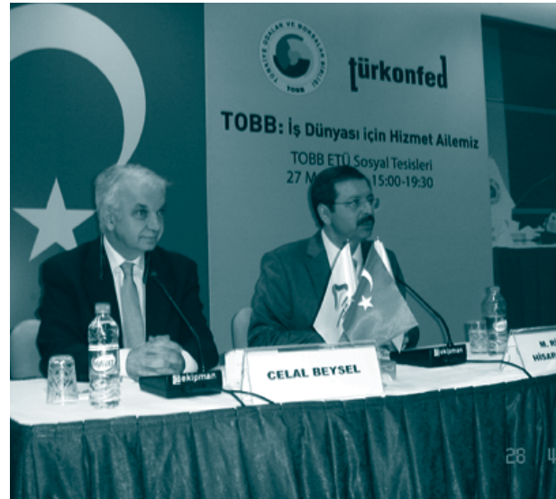
TÜRKONFED Başkanı Celal Beysel ve TOBB Başkanı Rifat Hisarcıkloğlu

Bu doğrultuda, 27 Mart 2009 tarihinde, Ankara’da TOBB Ekonomi ve Teknoloji Üniversitesi’nde “TÜRKONFED Üyeleri için TOBB Ailesini Oluşturan Kurumlar Hakkında Brifing” başlıklı bir toplantı düzenlendi.