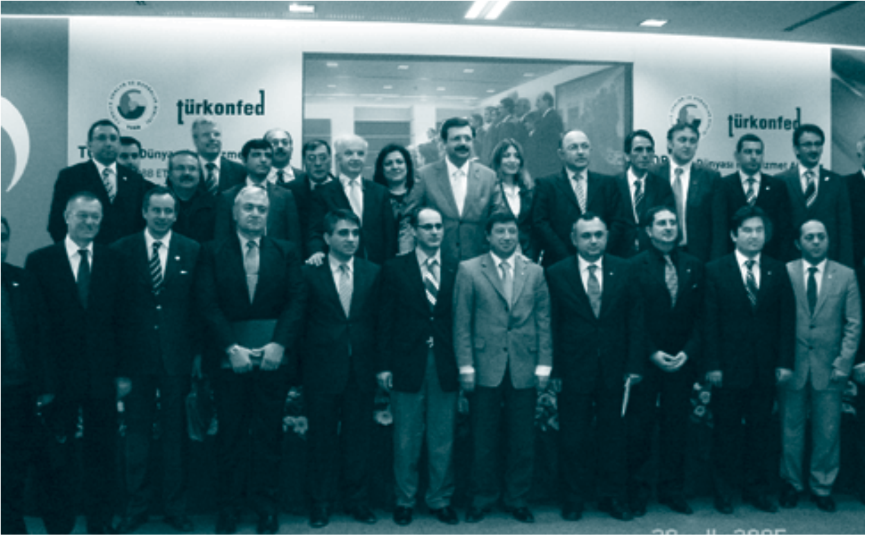
TÜRKONFED Üyeleri için TOBB Ailesini Oluşturan Kurumlar Hakkında Brifing, 27 Mart 2009

Ekonomi Politikaları Araştırma Vakfı (TEPAV), TOBB Ekonomi ve Teknoloji Üniversitesi, Gümrük Turizm A.Ş ve KOBİ Girişim Sermayesi Yatırım Ortaklığı A.Ş temsilcileri kurumlarını tanıtan kısa sunumlar yaptılar. Toplantı soruların cevaplanması ile sona erdi.