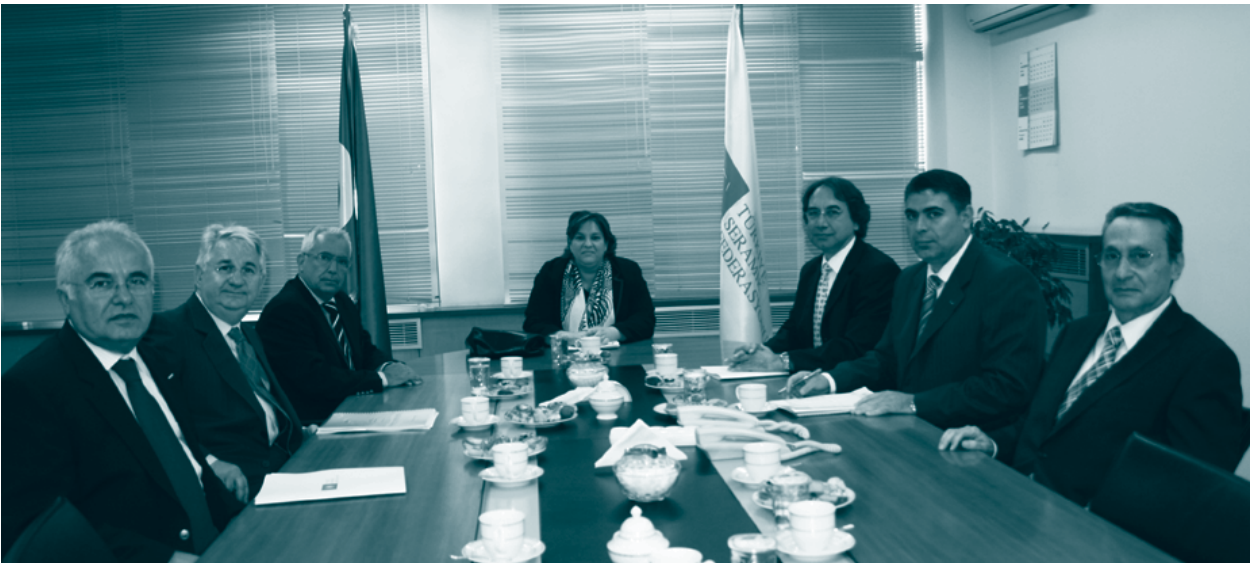
SERFED Yönetim Kurulu.

TÜRKONFED'e katılan Türkiye Seramik Federasyonu'na bağlı dernekler şunlar: Seramik Kaplama Malzemeleri Üreticileri Derneği, Seramik Sağlık Gereçleri Üreticileri Derneği, Seramik, Cam ve Çimento Hammaddeleri Üreticileri Derneği, Seramik ve Refrakter Üreticileri Derneği, Tesisat İnşaat Malzemecileri Derneği ve Türk Seramik Derneği.