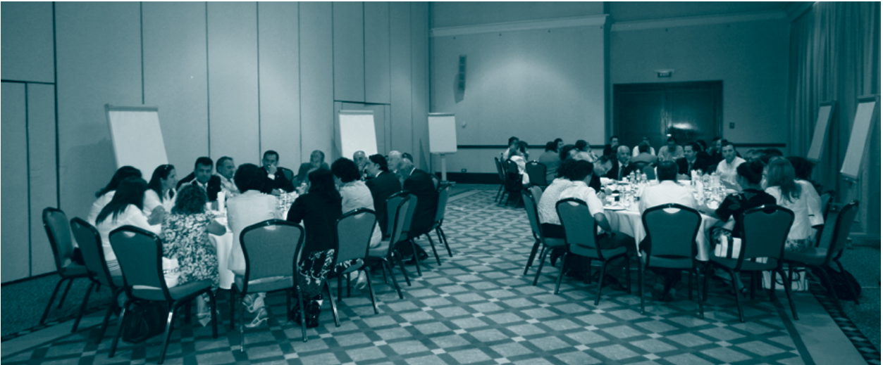
Yuvarlak masa çalışmaları, 25 Mayıs 2009, Adana

Toplantı, Girişim Sermayesine Erişim Sorunları, İnovasyon ve Ar-Ge Finansmanı ve Mevzuat ve Bürokrasi Kaynaklı Sorunlar başlıkları altında gerçekleştirilen yuvarlak masa çalışmaları ile sona erdi.