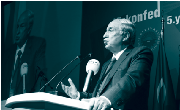
Hüsnü Özyeğin, FİBA Grubu Yönetim Kurulu Başkanı

TÜRKONFED 5. kuruluş yıldönümü gala yemeğinin konuk konuşmacısı, FİBA Grup Yönetim Kurulu Başkanı Hüsnü Özyeğin'di. Özyeğin, yaptığı konuşmada, Türk insanının girişimci karakterini överek doğuştan girişimci bir ruha sahip olduğunu, bu nedenle de büyük başarılarla imza atabildiklerinden bahsetti. Özyeğin konuşmasında kendi girişimcilik yolculuğundan da örnekler verdi.