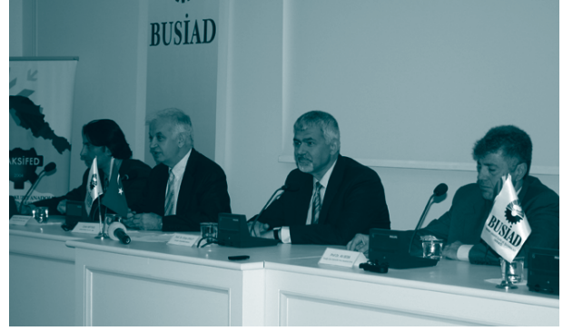
YENİKOBİ toplantısı, 12 Haziran 2009, Bursa

TÜRKONFED Başkanı Celal Beysel, Bursa'da yapılan toplantıda projelerinin önemine değinerek "Ankara ve Adana'dan sonra benim şehrim olan Bursa'da da gördüğümüz ilgi beni çok gururlandırdı. YENİKOBİ projesinin tüm KOBİ'ler için ve daha da iddialı olmak gerekirse Türkiye ekonomisi için önemli bir mihenk taşı oluşturacağına inanıyorum." dedi.