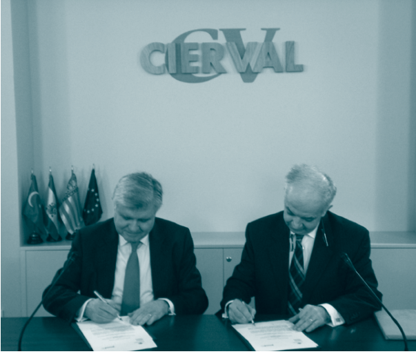
TÜRKONFED – CIERVAL işbirliği protokolü imza töreni, 5 Mart 2009, Valencia