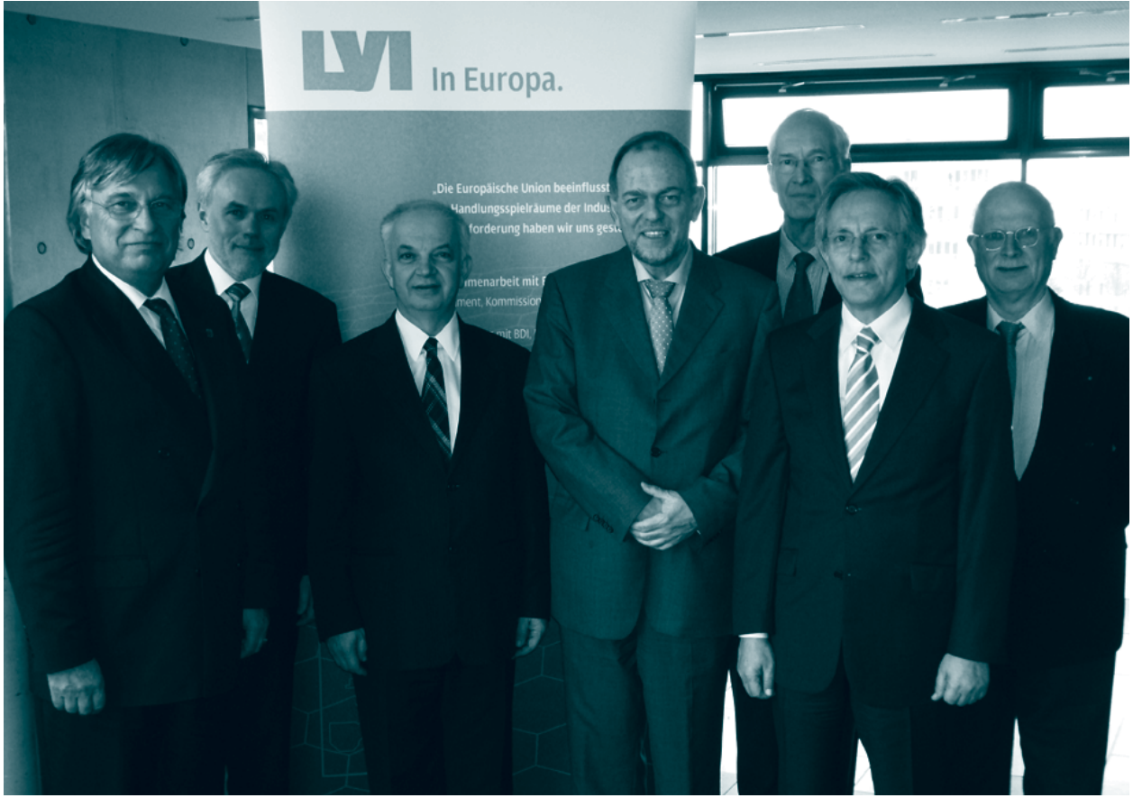
LVI iş geliştirme ve işbirliği toplantısı, 1 Nisan 2009, Stuttgart

işbirliğini güçlendirmeyi amaçlayan bir protokol imzalandı.