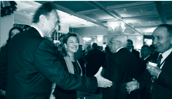
TÜRKONFED 5. Kuruluş Yıldönümü Kokteyli, 17 Aralık 2009, Silivri

Zirve programı, TÜRKONFED'in 5. kuruluş yıldönümü kutlamaları programı kapsamında kokteyl ve gala