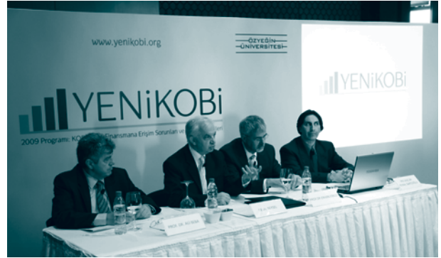
YENİKOBİ Basın Toplantısı, 13 Mayıs 2009, İstanbul

Tanıtım toplantısında TÜRKONFED Başkanı Celal Beysel, “Herkes krizin dibi göründü mü tartışmaları içindeyken biz KOBİ’lerimizi krizden en az hasarla kurtarmanın yollarını arıyoruz. Bunu aramakla da kalmıyor, gözümüzü biraz daha uzaklara dikiyoruz. Biz, kriz sonrasında Türkiye’sini ve KOBİ’lerini şimdiden oluşturmaya çalışıyoruz. Bir yandan krizin yakıcı etkilerine çözüm ararken bir yandan da KOBİ’lerin altyapısal dönüşümlerini başlatalım, kurumsal yapılanmalarına destek olalım, kısacası YENİKOBİ’yi oluşturalım istiyoruz” dedi.