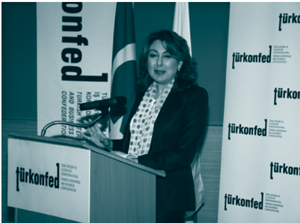
Arzuhan Doğan Yalçındağ, TÜSIAD Yönetim Kurulu Başkanı