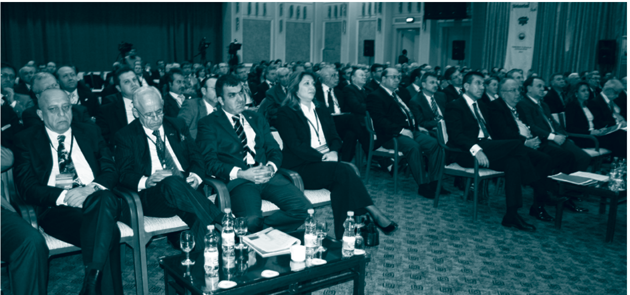
13. Girişim ve İş Dünyası Zirvesi, 18 Aralık 2009, Silivri

Zirve, federasyon ve dernek başkanlarının siyasi ve ekonomik gündemi değerlendirme oturumu ve Silivri SIAD’ın plaket töreni ile sona erdi.