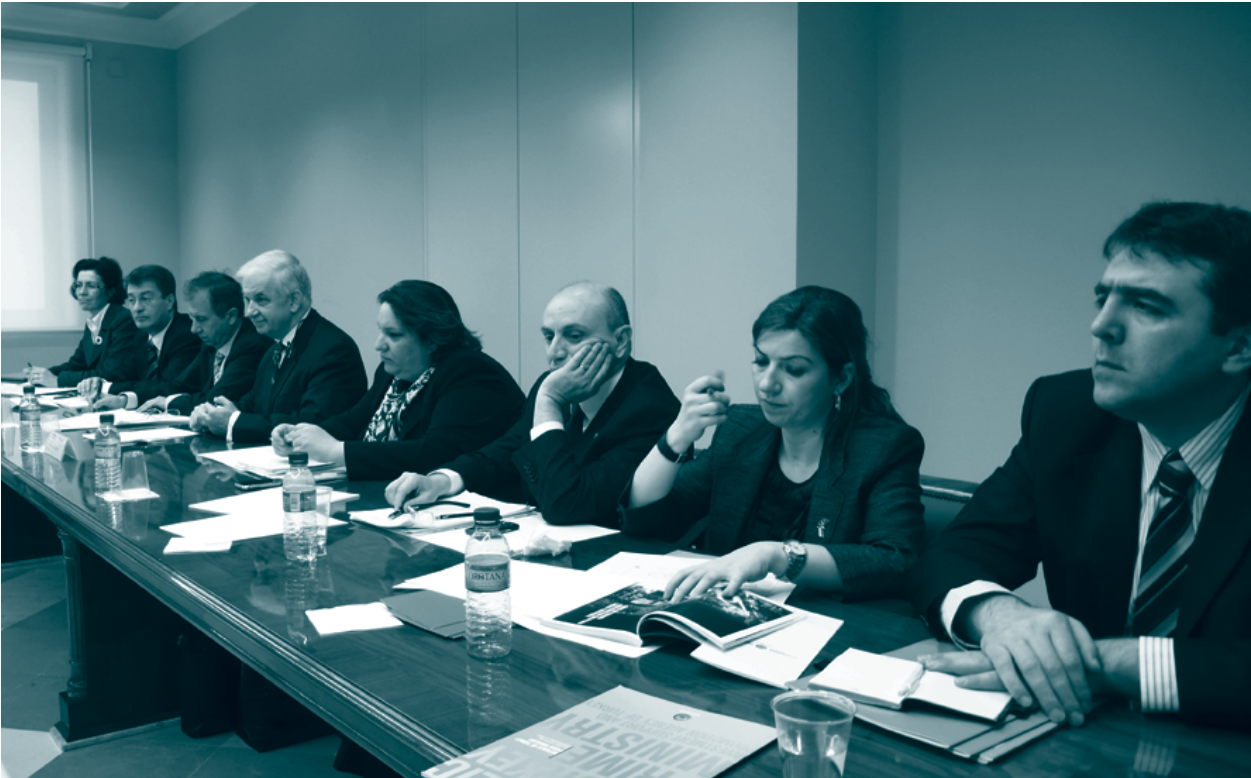
İspanya iş geliştirme gezisi TÜRKONFED heyeti

18 Kasım 2008 tarihinde, TÜRKONFED üye federasyonlarından İÇASİFED liderliğinde, KOSGEB ve Alman Baden-Württemberg Sanayiciler Derneği (LVI) temsilcilerinden oluşan bir heyetin TÜRKONFED'i ziyaretini takiben, TÜRKONFED ve diğer taraflar arasında kurumlar ve ilgili bölgeler arasında