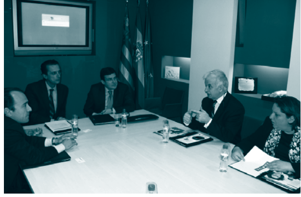
IMPIVA Kalkınma Ajansı ziyareti, 5 Mart 2009, Madrid