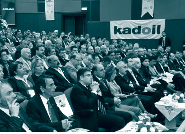
TÜRKONFED Başkanlar Konseyi, 21 Nisan 2009, Mardin

dernek başkanlarının siyasi ve ekonomik gündem değerlendirmelerine geçildi. Değerlendirmelerde kriz tedbirleri, üretim düşüşleri ve teşvikler konuları gündeme geldi. TÜRKONFED Başkanlar Konseyi plaket töreni ile sona erdi.