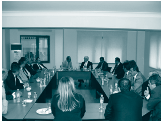
Diyarbakır Barosu Başkanı Mehmet Emin Aktar ziyareti, 8 Ekim 2009, Diyarbakır

TÜRKONFED ve DOGÜNSİFED yönetim kurullarından oluşan heyet ilk olarak Diyarbakır Vali Yardımcısı Mehmet Yeşilbaş'ı ziyaret etti. Heyet aynı gün içinde Diyarbakır Büyükşehir Belediye Başkanı Osman Baydemir ve Diyarbakır Barosu Başkanı Mehmet Emin Aktar ile de görüştü.