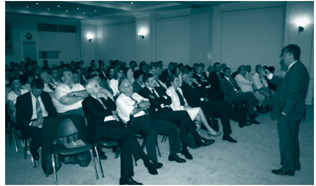
İş planı hazırlama eğitimi, 12 Haziran 2009, Bursa